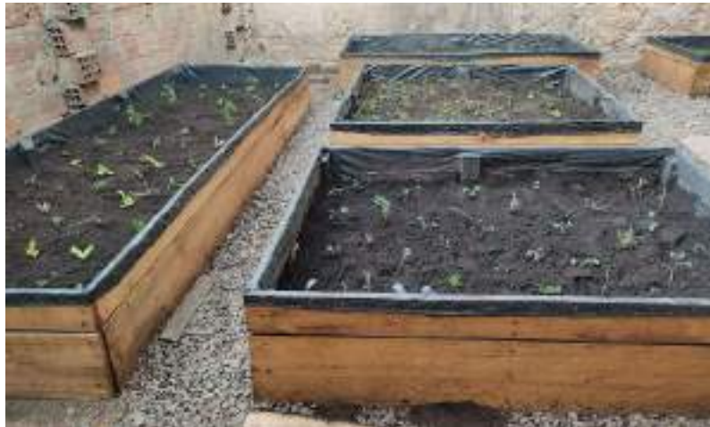
Camas de cultivo instaladas y sembradas por la comunidad con el acompañamiento del Jardín Botánico de Bogotá.

A lo largo de la ejecución del proyecto, desde la Fundación Proyectar Sin Fronteras se acompañaron los procesos de co-creación de la cocina comunitaria, elaborando un análisis de la normatividad aplicable a la construcción y dando recomendaciones para el diseño de la misma.