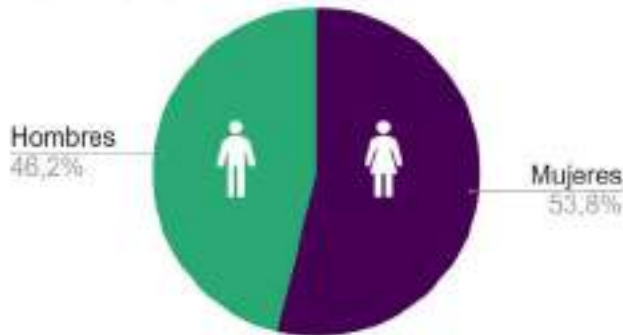
Repartición por género

Además de promover la equidad de género en nuestros proyectos, nuestro equipo ha mantenido un equilibrio en la vinculación de hombres y mujeres.