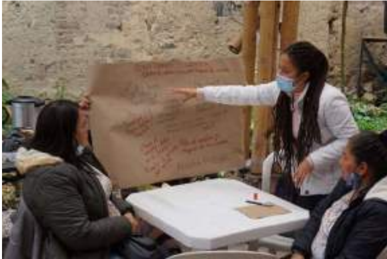
Taller de recuperación del patrimonio gastronómico e identificación de alimentos a sembrar. PSF, 2021.

Por otra parte, se desarrollaron talleres participativos enfocados en fortalecer las capacidades organizativas de la comunidad para el manejo adecuado de la huerta. Se realizaron diversas actividades, incluyendo la identificación de actores y árbol de problemas para la huerta, la identificación de alimentos idóneos para la cocina y la huerta y la elaboración de planes de siembra participativos con los actores de la huerta.