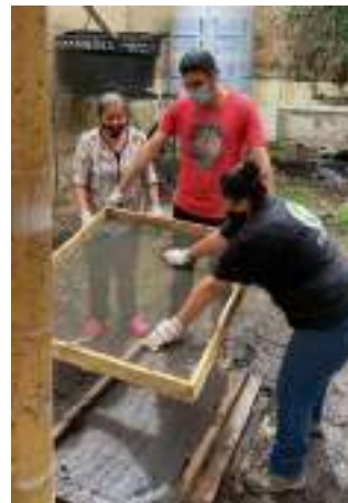
Minga adecuación del espacio. PSF, 2021.