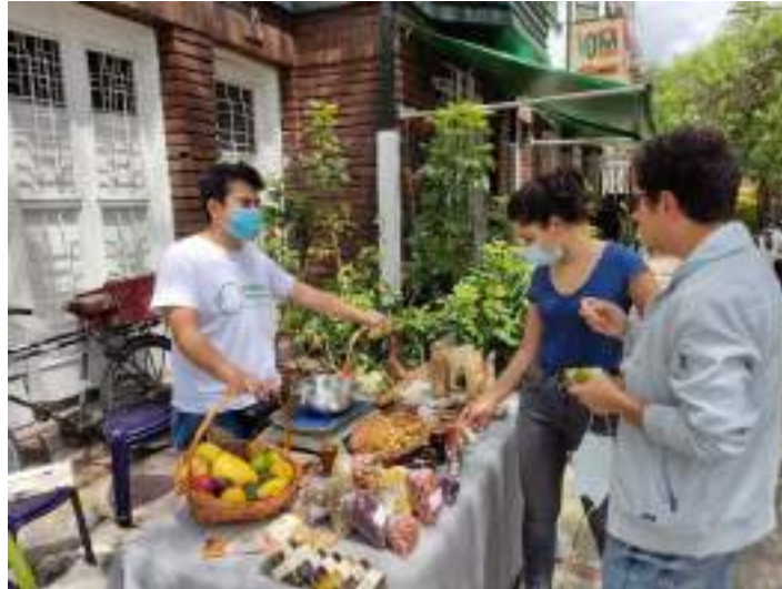
Feria Agroecológica en el restaurante iOm Cocina Vegana.