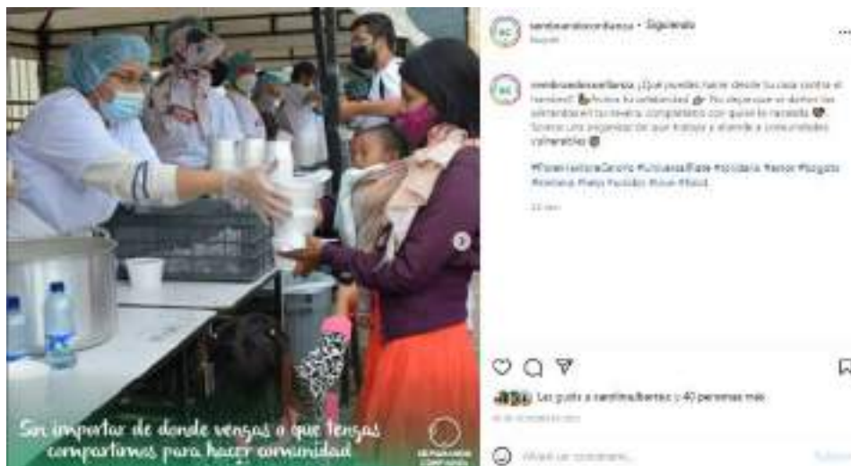
Participación de Proyectar Sin Fronteras en el Universal Plate, 2021.

Durante la jornada participaron 50 organizaciones, entidades y restaurantes, se vincularon 200 voluntarios, se sirvieron 6.500 platos de sopa servidos en la Plaza de Bolívar, 1.600 platos fueron entregados a las comunidades indígenas en el Parque Nacional, 1.200 en el Parque Tercer Milenio, la plaza de La Mariposa, San Victorino y alrededores de la plaza de Bolívar a vendedores ambulantes, trabajadoras sexuales, habitantes de la calle y transeúntes, y otras 500 porciones fueron entregadas a fundaciones y hogares.