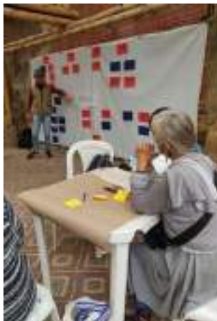
Taller de árbol de problemas. PSF, 2021.

Por otra parte, se desarrollaron talleres participativos enfocados en fortalecer las capacidades organizativas de la comunidad para el manejo adecuado de la huerta. Se realizaron diversas actividades, incluyendo la identificación de actores y árbol de problemas para la huerta, la identificación de alimentos idóneos para la cocina y la huerta y la elaboración de planes de siembra participativos con los actores de la huerta.